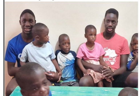
Deze 2 pasten ooit aan deze tafel