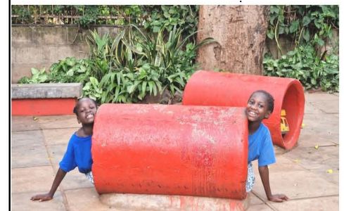
Plezier in de geschilderde rioolbuis