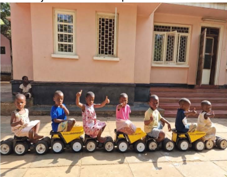
Tonka is het favoriete speelgoed