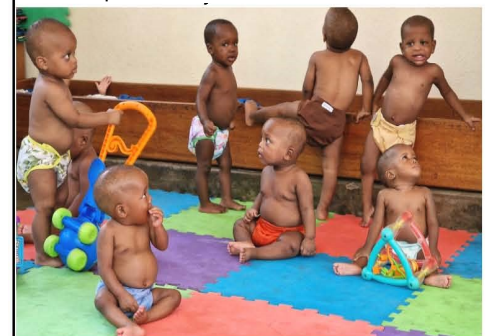
Onze baby's in 'Bebeboo' luiers