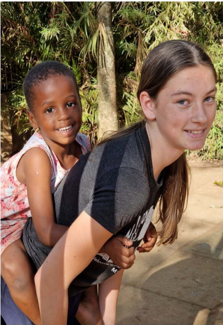
Dit meisje werd verliefd op de kinderen