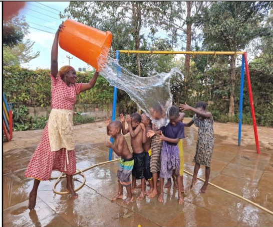
Een manier om af te koelen in de vreselijke hitte