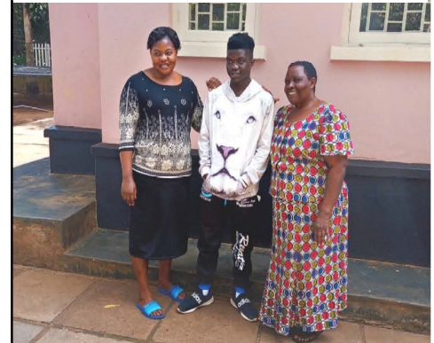
Joy en Milly verzorgden hem als baby