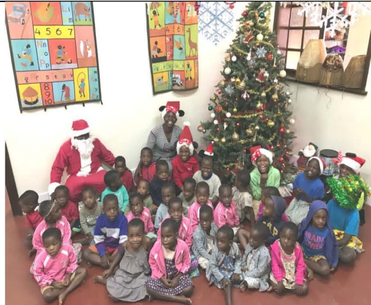
Kerst was een fantastische tijd Beste Welcome Home vrienden en familie,