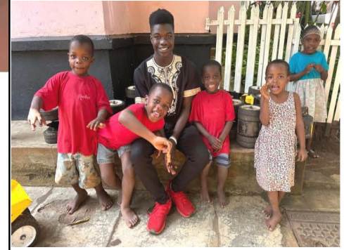
Op visite bij WH en zijn biologische familie