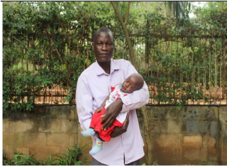
Moeder overleden, vader kan niet zorgen