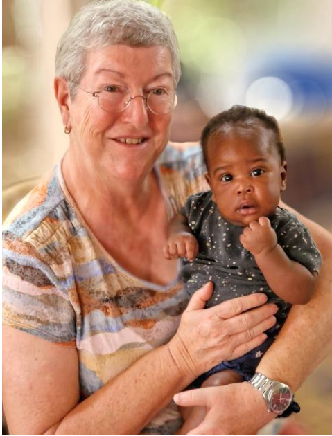
Liefde uit Nederland, een trouwe vrijwilligster.