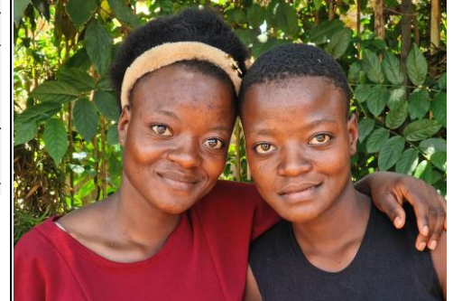
Twee van de drieling leren voor kapster.