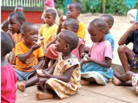
Eieren belangrijk voor hun gezondheid.